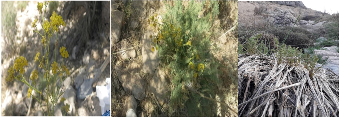
شکل (2): نمایی از مراحل رویشی خوشاریزه کوهستانی (عکس راست فروردین‌ماه؛ عکس وسط: خردادماه؛ عکس چپ: تیرماه).